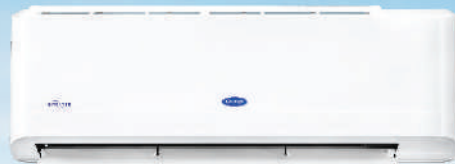
รุ่น 42TEVGB024-703 รุ่น 42TEVGB028-703