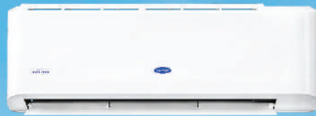
รุ่น 42TEVGB013-703 รุ่น 42TEVGB018-703